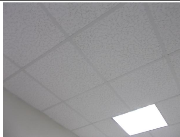
Prélèvement - P1 : IUT SCOLARITE > R+0 > A0000, A0006A - Faux plafond- (Absence d'amiante)