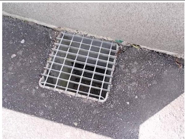
Déclaré - SO : IUT SCOLARITE > extérieur - Conduit - EP- (Présence d'amiante)